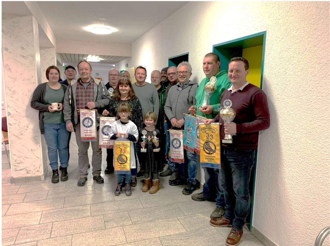
Die stolzen Gewinner der Sonderschau in Heldenfingen