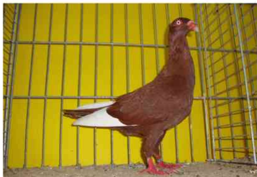
V 97 BB 1,0 jung Marshall Kai

Auf die schwarzen folgten die roten Weißschläge. Alleinaussteller Kai Marschall war erfolgreich mit V-BB auf 1,0 jung. Herzlichen Glückwunsch für diese züchterische Leistung.